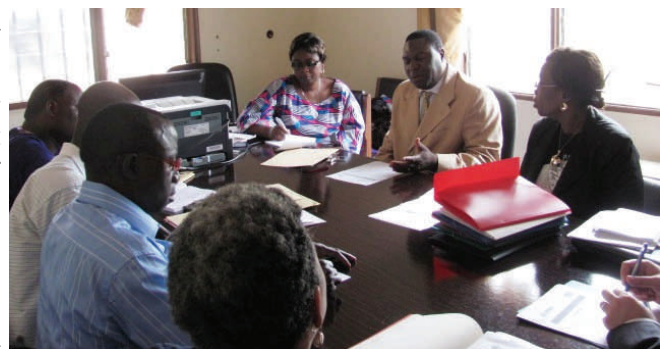
Le DIP à la séance de travail avec les D/ENIs

La signature de la charte est intervenue après plusieurs séances de travail tenues avec les directeurs. La dernière réunion en date du 16 Avril 2012, a été tenue à la direction de l'Inspection Pédagogique en présence des responsables du Projet TMT, du DIP, de son adjoint et du point Focal du projet TMT et des directeurs des ENIs ou leurs représentants.