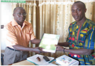
Remise du manuel à l'ENI de Kandi